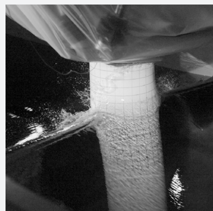
Effort d'impact sur une maquette montée sur un hexapode pour simuler les mouvements et les angles d'inclinaison d'une éolienne flottante